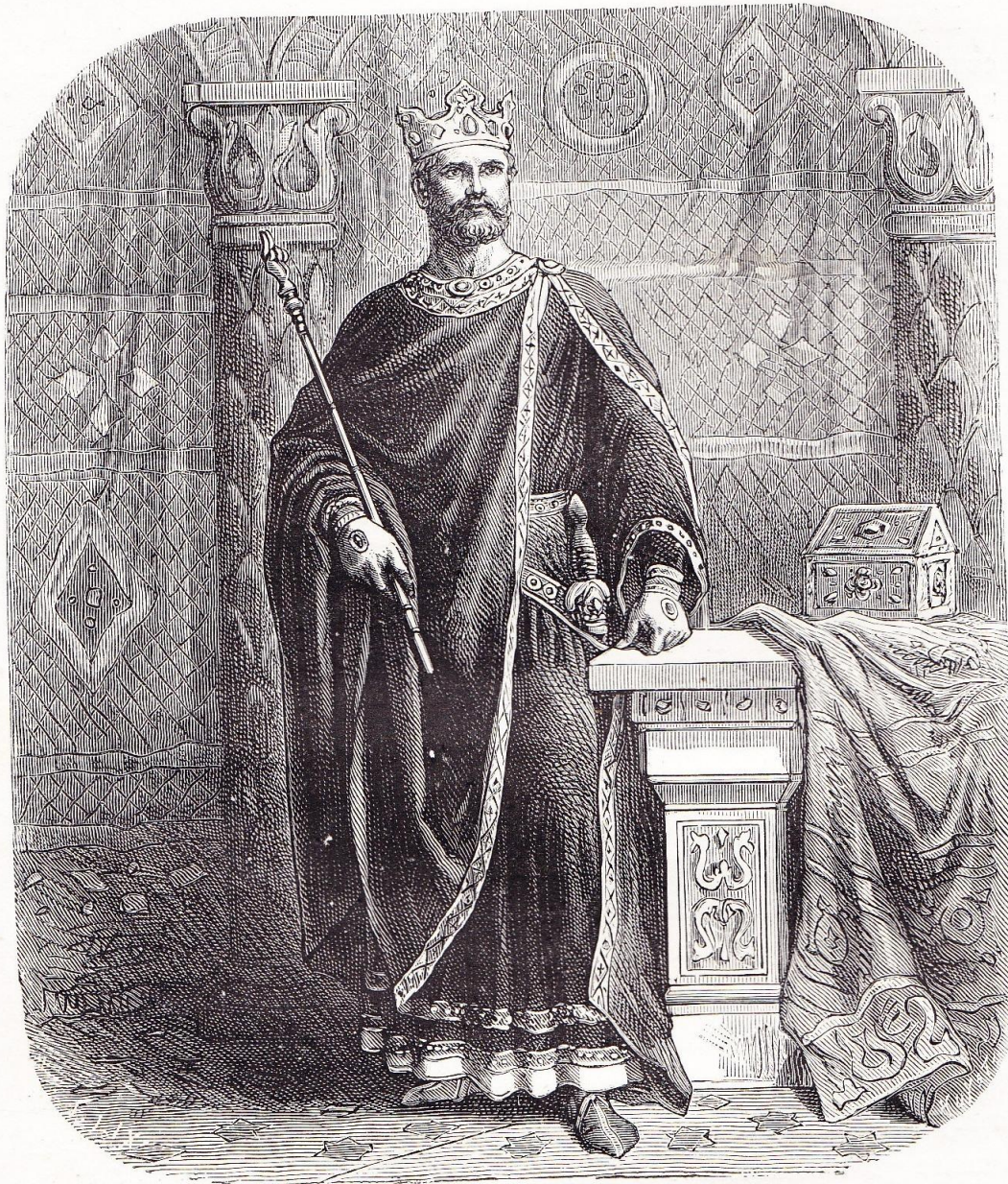
Richard Cœur de Lion.

« Dois-je sitôt me compromettre dans les bonnes grâces de mon souverain? » pensait-il. « Oui, par saint Christophe, il le faut! Je serais indigne de ses bontés si je ne risquais rien pour lui être utile. Gâtebourse, »